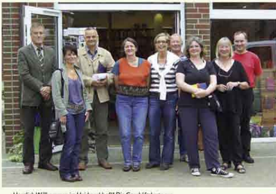
„Herzlich Willkommen im Heidmarkhof!“ Die Geschäftsleute aus dem Herzen Salzhausens laden zum Bummel ein.

(ph). Salzhausen. „Ein Schmuckstück im Herzen Salzhausens!“ – so hieß es in unserer Juni-Ausgabe. Gemeint war der Heidmarkhof, der zu diesem Zeitpunkt erst teilweise bezogen war. Inzwischen ist das kleine Geschäftszentrum komplettiert und die ersten der attraktiven Wohnungen sind vermietet, allerdings sind auch noch welche frei. Architekt freut sich über die positive Resonanz auf das „gelungene Werk“, das demnächst noch durch Bäume begründet wird. Ein ansprechendes Ambiente und gute Parkmöglichkeiten laden zum Shopping ein. Der Kirch- und Markttag ist sozusagen die Einweihungs-Party des Heidmarkhofes. Mit phantasievollen und exotischen Cocktails, die ein Barkeeper mixt, kann man bei der Boutique Tiffany anstoßen. Der Party-Service Schulenburg lockt mit köstlichen Gaumenfreuden, wie