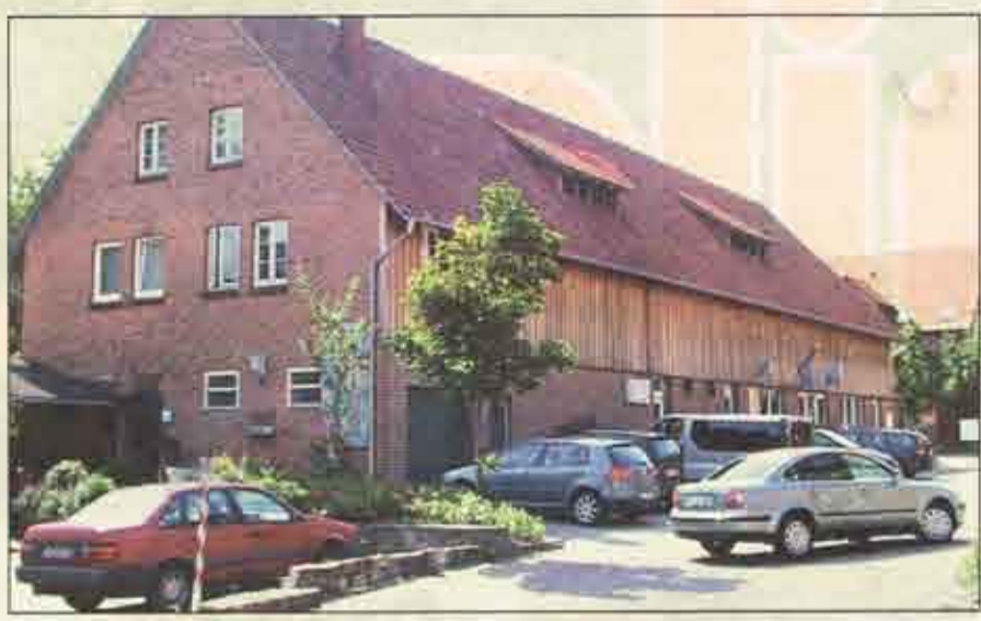
Wird in ein Wohn- und Geschäftshaus umgebaut: das frühere Stallgebäude auf dem Haidmarkhof-Gelände

ce. SALZHAUSEN. Im Ortskern von Salzhausen stehen wortwörtlich große Veränderungen ins Haus. Auf dem Haidmarkhof-Gelände an der Hauptstraße will die gemeinnützige Hamburger Benno und Inge Behrens-Stiftung, die in der Hansestadt und Umgebung Wohnanlagen für bedürftige Menschen baut, im ersten und zweiten Stock eines ehemaligen Stallgebäudes insgesamt acht Wohnungen bauen und Räumlichkeiten für Dienstleister schaffen. Im Erdgeschoss soll eine Ladenzeile entstehen. „Dort wird sich nach dem Umbau das Kindermoden-Geschäft WiWi-Kids verbreitern, und die Boutique Tiffany wird vom Rathausplatz auf das Haidmarkhof-